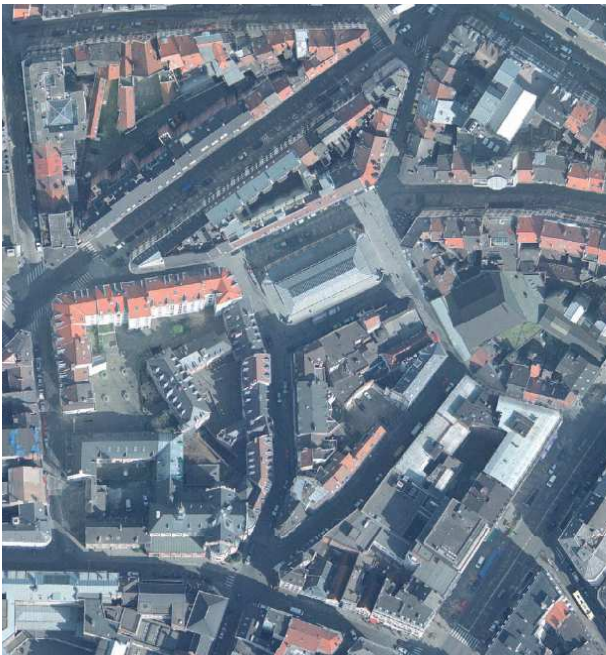
Photo aérienne du quartier Saint-Géry