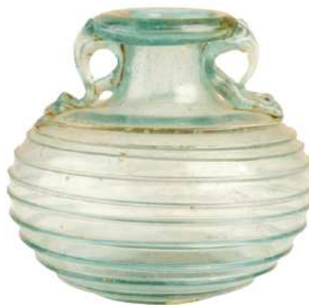
Aryballe d'époque romaine

On affirme plus communément qu'aux environs de 980 Charles, duc de Basse Lotharingie et frère de Lothaire, roi de France, aurait choisi Bruxelles pour demeure et fait bâtir un castrum dans une des îles de la Senne. Selon certains auteurs, celui-ci se serait élevé au lieu-dit Borgval, toponyme que l'on pourrait traduire par « enceinte du château ».