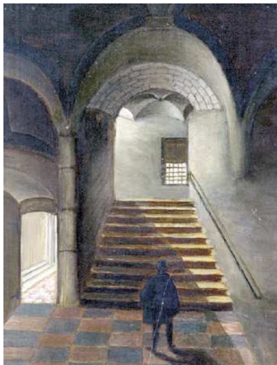
À en croire Le Bon Génie , revue encyclopédique pour la jeunesse qui en publia le dessin en 1834, un escalier monumental, reste du château du duc de Basse Lotharingie, aurait subsisté jusqu’au début du XIX e siècle, dans une des maisons de l’île, la brasserie du Ballot d’Or 6 . Mais un article sur le sujet rédigé un siècle plus tard montre sans conteste que ledit escalier, entre-temps détruit, n’aurait guère remonté au-delà de la fin du XVI e siècle 10 .

fiée du duc de Basse Lotharingie, mais bien plutôt une église-fille de l’église du domaine de Molenbeek consacrée à saint Jean. Ce n’est que lorsque ce domaine échut en 977 au duc de Basse Lotharingie que ce dernier aurait décidé de faire construire dans le hameau de Brosella, sur une île voisine de celle de Saint-Géry, un château 5 .