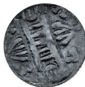
Denier dit « au pont », XIII e siècle